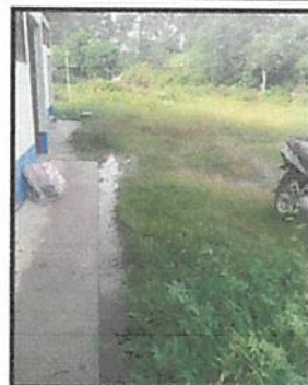
Foto 4: El agua se reposa en el patio, por lo que provoca criadero de zancudos.