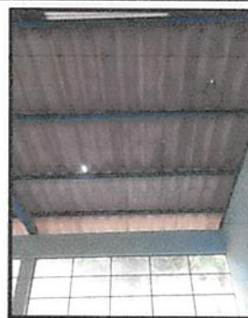
Foto 6: Techo dañado, provocando que el agua entre en las aulas, causando daño en los materiales y recursos educativos.

Observación: Si es necesario se pueden agregar hojas adicionales y actualizar el número de hojas.