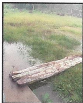
Foto 3: El agua de la fosa provoca inundación en el patio de la escuela